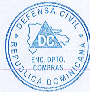
Melbin Rondón Brito Encargado de Compras. Defensa Civil