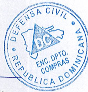
Melbin Rondón Brito Encargado de Compras. Defensa Civil